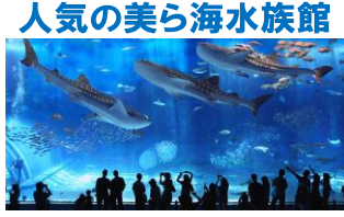
人気の美ら海水族館